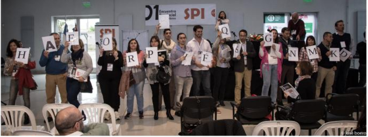
Los moderadores de los grupos de trabajo

Los jubilados SPI no son alcanzados por las mejoras económicas que obtienen los trabajadores activos SPI.